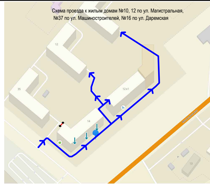
Схема проезда к жилым домам №10, 12 по ул. Магистральная, №37 по ул. Машиностроителей, №16 по ул. Даремская

Примечание: Целью проекта является исключение сквозного проезда по дворовой территории многоквартирного жилого дома по адресу ул. Магистральная, 14. Объезд дворовой территории многоквартирного жилого дома возможен по существующему проезду со стороны ул. Магистральная. В настоящее время проезд по двору МЖД является наикратчайшим расстоянием по которому жители многоквартирных жилых домов, расположенных в глубине квартала (Магистральная, 10,12; Машиностроителей 37; Даремская, 16) осуществляют подъезд к своим домам. В рамках проекта устанавливается дорожное препятствие типа Цепной барьер "Парконт-100". Таран цепи барьера "на разрыв" гарантированно не повреждает механизм, при этом энергия разрыва передается на корпус, что не препятствует проезду пожарной техники к многоквартирному жилому дому.