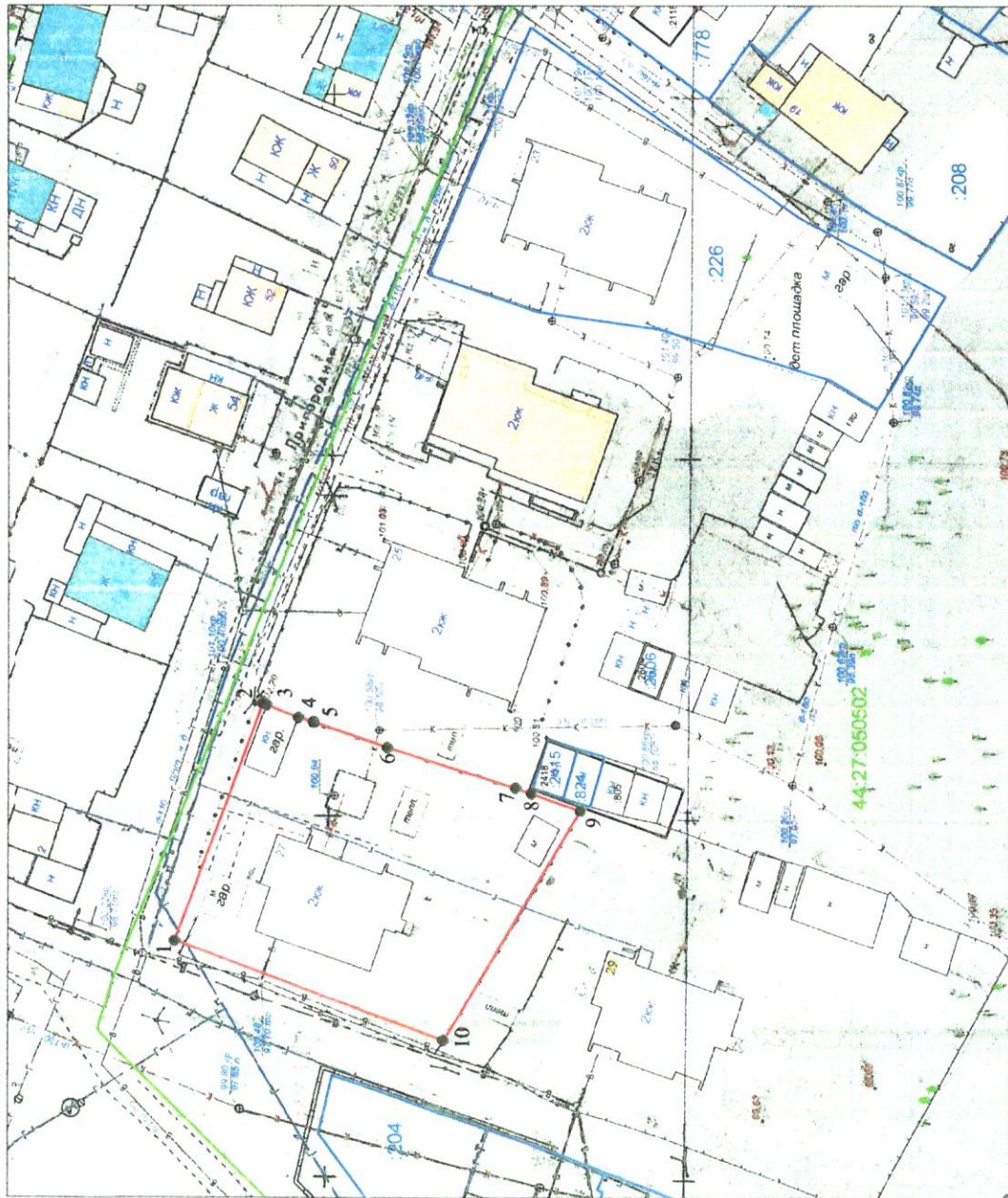
СХЕМА РАСПОЛОЖЕНИЯ земельного участка или земельных участков на кадастровом плане территории