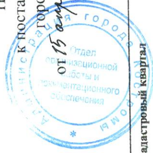
СХЕМА РАСПОЛОЖЕНИЯ земельного участка или земельных участков на кадастровом плане территории