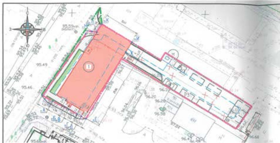
Экспликация зданий и сооружений