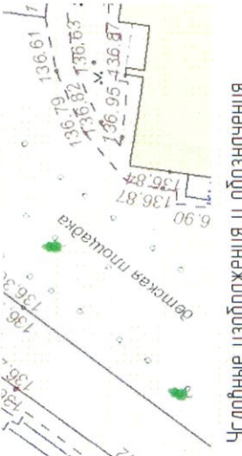
Условные изображения и обозначения