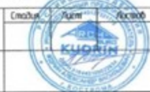
Схема планировочной организации земельного участка, М 1500