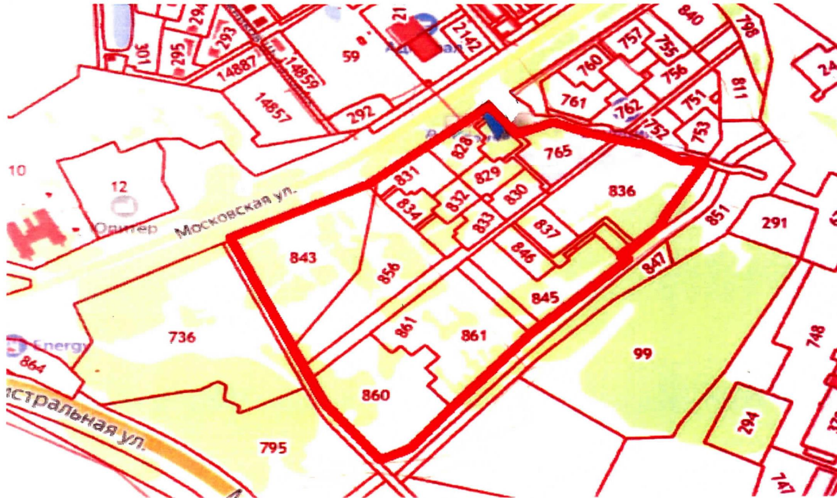
Ситуационный план зоны среднеэтажной жилой застройки Ж-3 по улице Московской

Приложение к постановлению Администрации города Костромы от 4 октября 2023 года № 1906