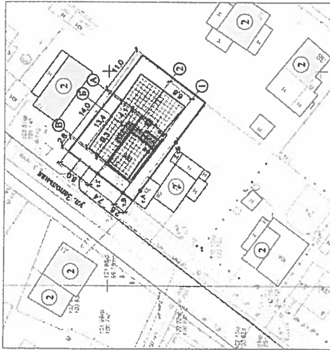
Схема планировочной организации земельного участка. М 1:500.