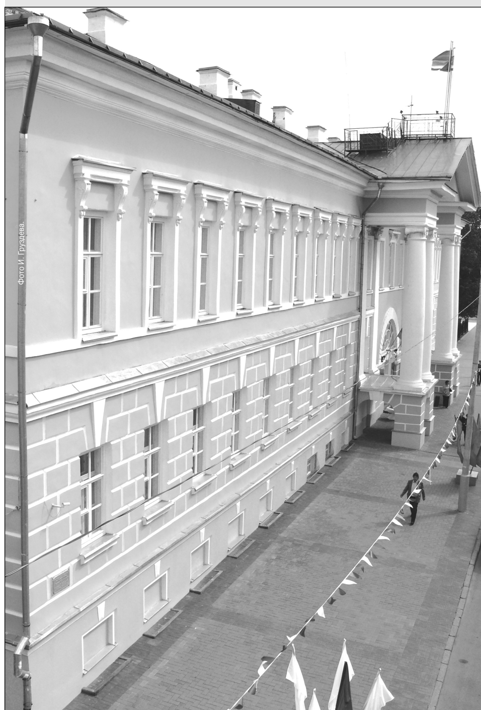
(Начало на стр. 1)

(Фамилия, имя, отчество полностью, подпись).