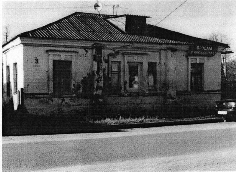
«Дом жилой Акатова, 1-я пол. XIX в.» г. Кострома, ул. Комсомольская, 31 Главный (юго-восточный) фасад

Приложение к охранному обязательству собственника или иного законного владельца объекта культурного наследия, включенного в единый государственный реестр объектов культурного наследия (памятников истории и культуры) народов Российской Федерации