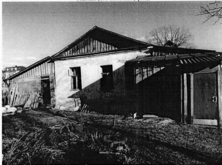
«Дом жилой Акатова, 1-я пол. XIX в.» г. Кострома, ул. Комсомольская, 31 Дворовый (северо-западный) фасад