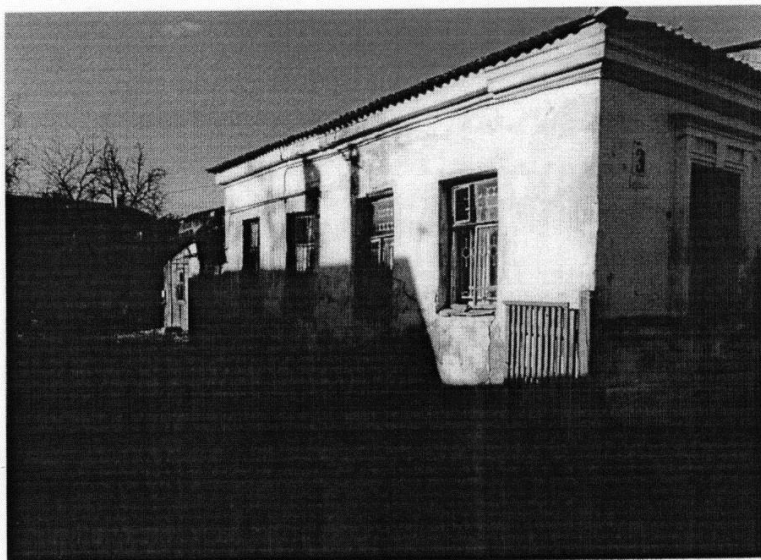
Дом жилой Акатова, 1-я пол. XIX в.» г. Кострома, ул. Комсомольская, 31 Боковой (юго-западный) фасад

Приложение к охранному обязательству собственника или иного законного владельца объекта культурного наследия, включенного в единый государственный реестр объектов культурного наследия (памятников истории и культуры) народов Российской Федерации