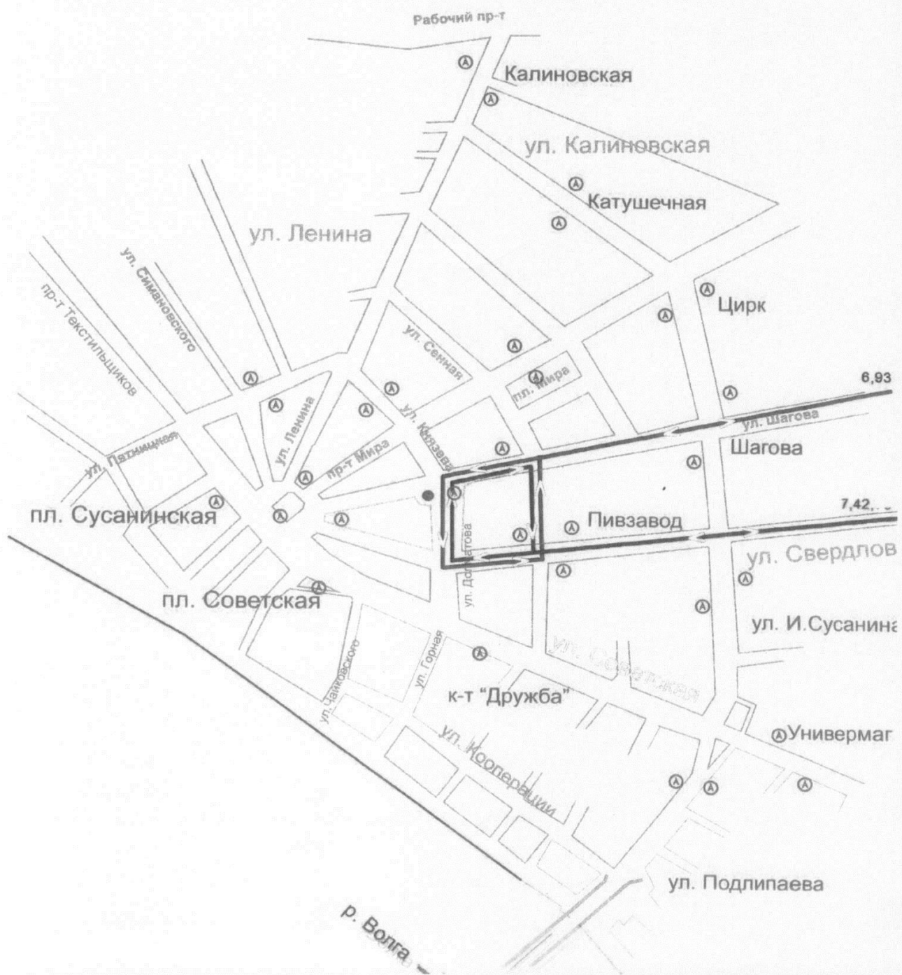
Схема движения городского пассажирского транспорта на период проведения в городе Костроме Международного ювелирного фестиваля «Золотое кольцо России» с 16 часов 00 минут 19 августа 2020 года до 9 часов 00 минут 24 августа

Приложение 2 к постановлению Администрации города Костромы от 19 августа 2020 года № 1555