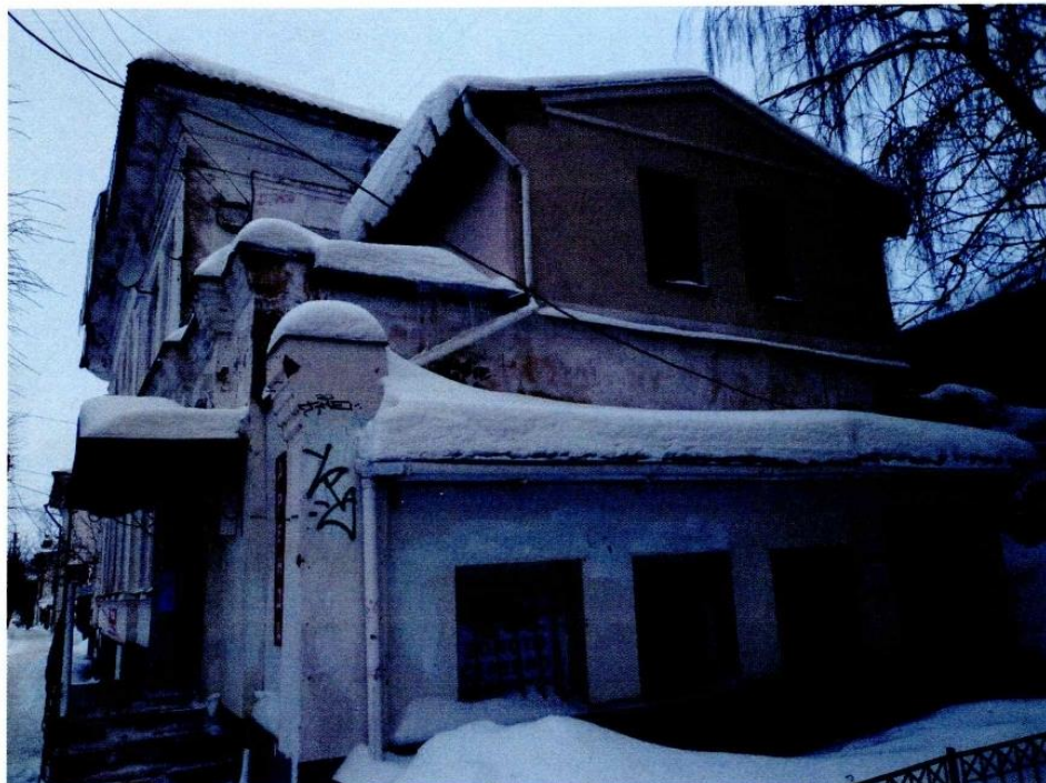
«Дом Русова», 1820-е гг г. Кострома, ул. Островского, 4 Боковой (юго-восточный) фасад

Приложение к охранному обязательству собственника или иного законного владельца объекта культурного наследия, включенного в единый государственный реестр объектов культурного наследия (памятников истории и культуры) народов Российской Федерации