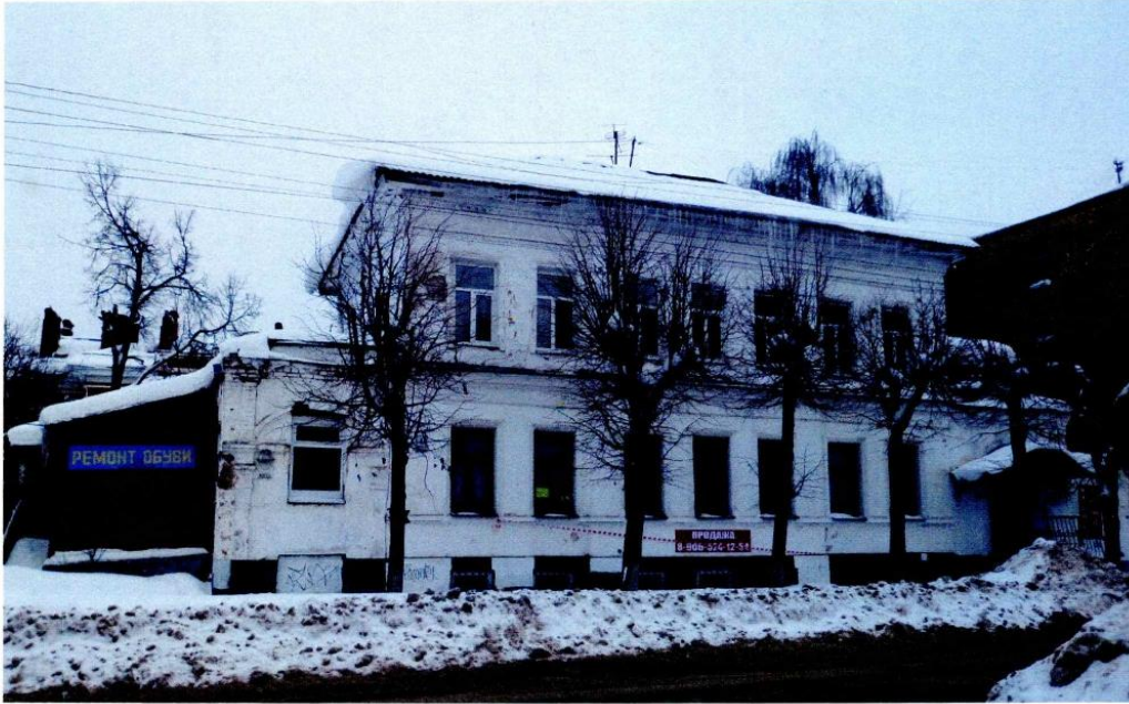
«Дом Русова», 1820-е гг г. Кострома, ул. Островского, 4 Главный (юго-западный) фасад

Приложение к охранному обязательству собственника или иного законного владельца объекта культурного наследия, включенного в единый государственный реестр объектов культурного наследия (памятников истории и культуры) народов Российской Федерации