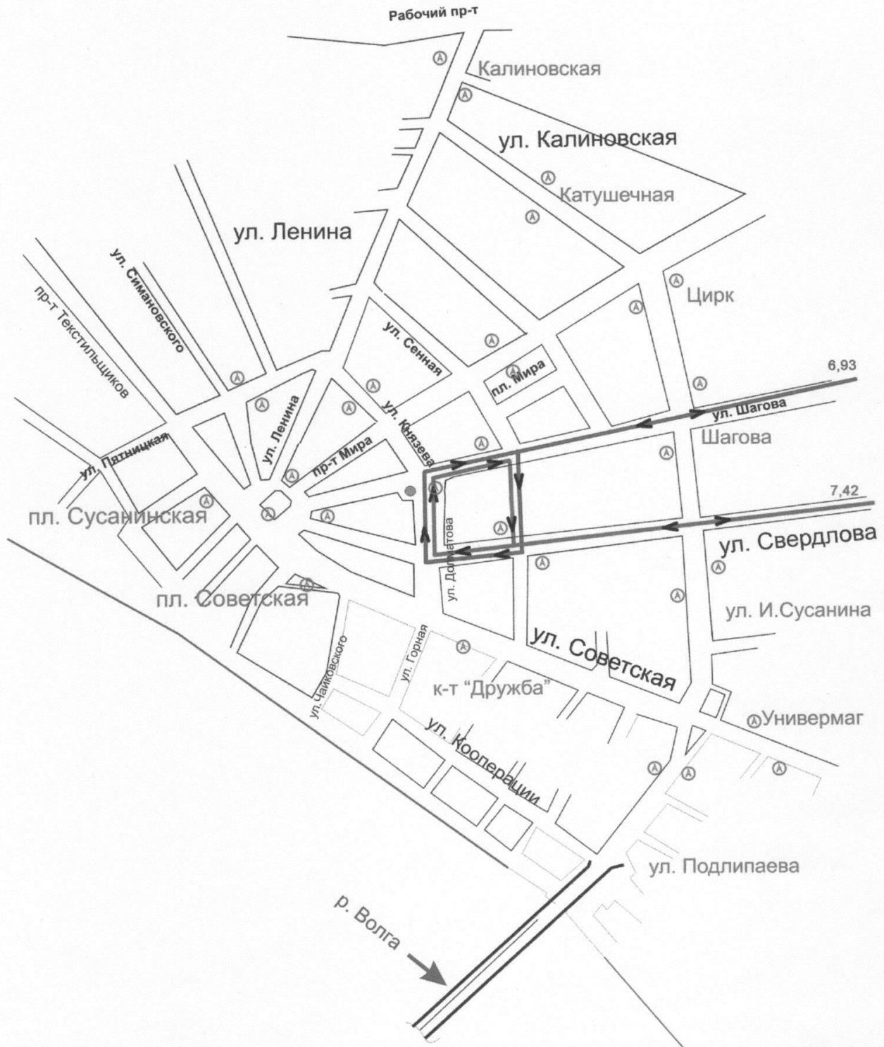
Схема движения городского пассажирского транспорта на период проведения в городе Костроме мероприятия «Праздник детства «Щедрое яблоко» (фестиваль детского творчества) 19 августа 2018 года с 10 часов 00 минут до 18 часов 00 минут

Приложение № 2 к постановлению Администрации города Костромы от « 14 » августа 2018 г. 1848