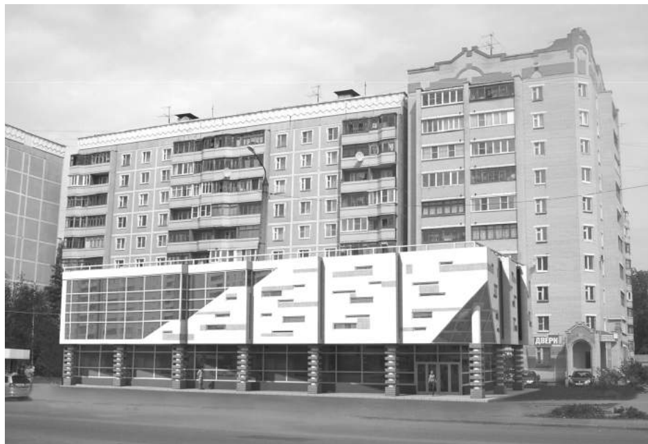
Столовая с продуктовым магазином по адресу: м/р Давыдовский-3, д. 4б, в г. Костроме.

Анкету направляйте по адресу: город Кострома, площадь Конституции, 2, Управление территориального планирования, городских земель, градостроительства, архитектуры и муниципального имущества Администрации города Костромы (каб. 404, тел. 42 70 72) или на электронную почту kui@admgor.kostroma.net