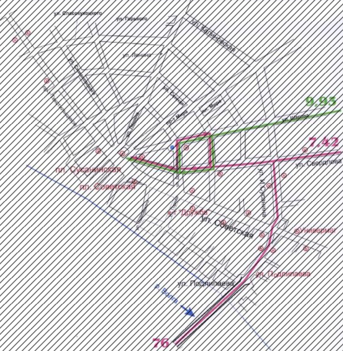
Схема изменения пути следования муниципальных автобусных маршрутов на период проведения в городе Костроме Областного фестиваля народного творчества «Костромская губернская ярмарка»

Приложение 3 к постановлению Администрации города Кострома от 29.12.2014 № 20/14 14020