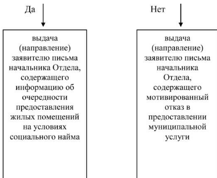
Приложение 3 к Административному регламенту предоставления Администрацией города Костромы муниципальной услуги по предоставлению информации об очередности предоставления жилых помещений на условиях социального найма