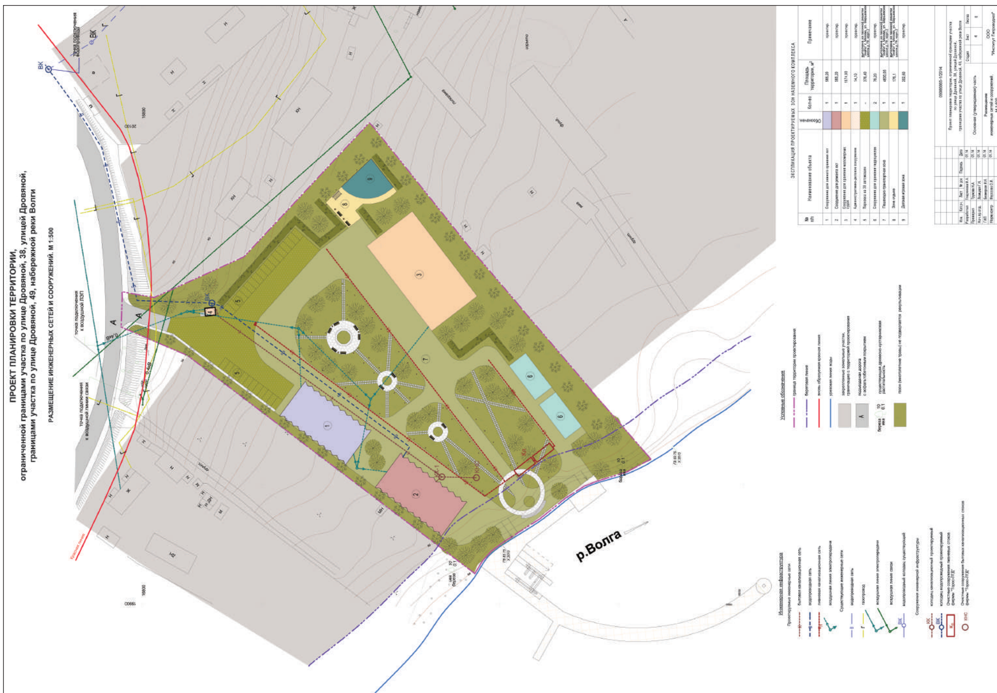
Проект планировки территории, ограниченной границами участка по улице Дровяной, 38, улицей Дровяной, границами участка по улице Дровяной, 49, набережной реки Волги Развертка со стороны реки Волги