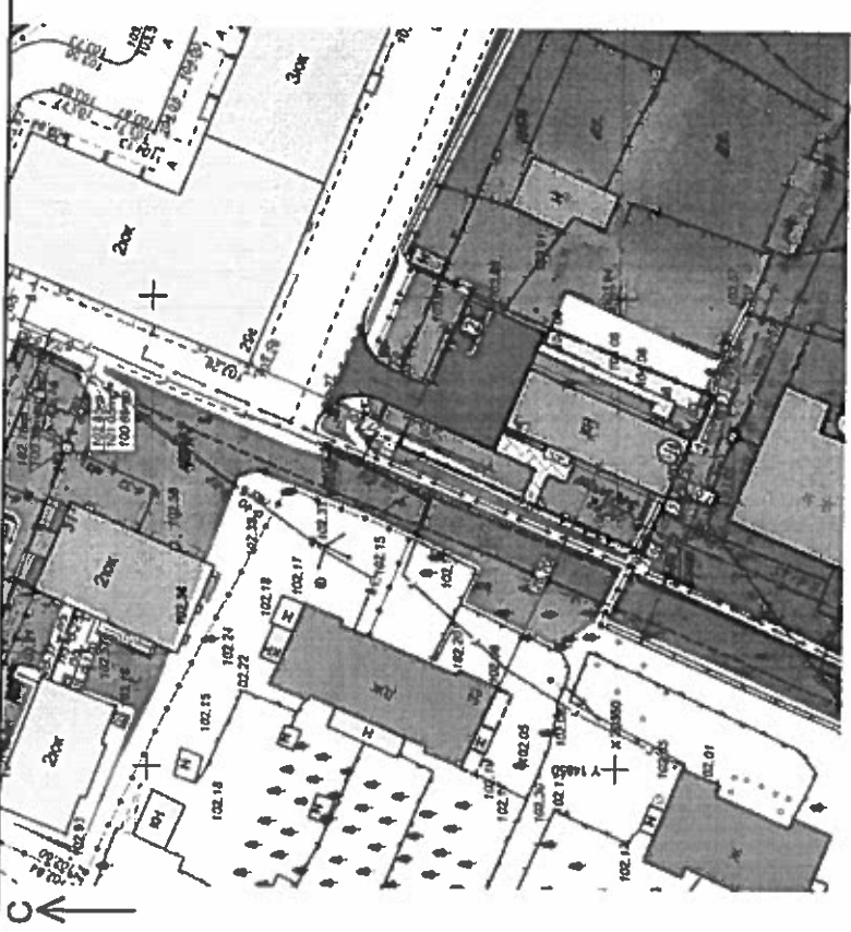
Таблица координат границ земельного участка. S уч. = 510 м².