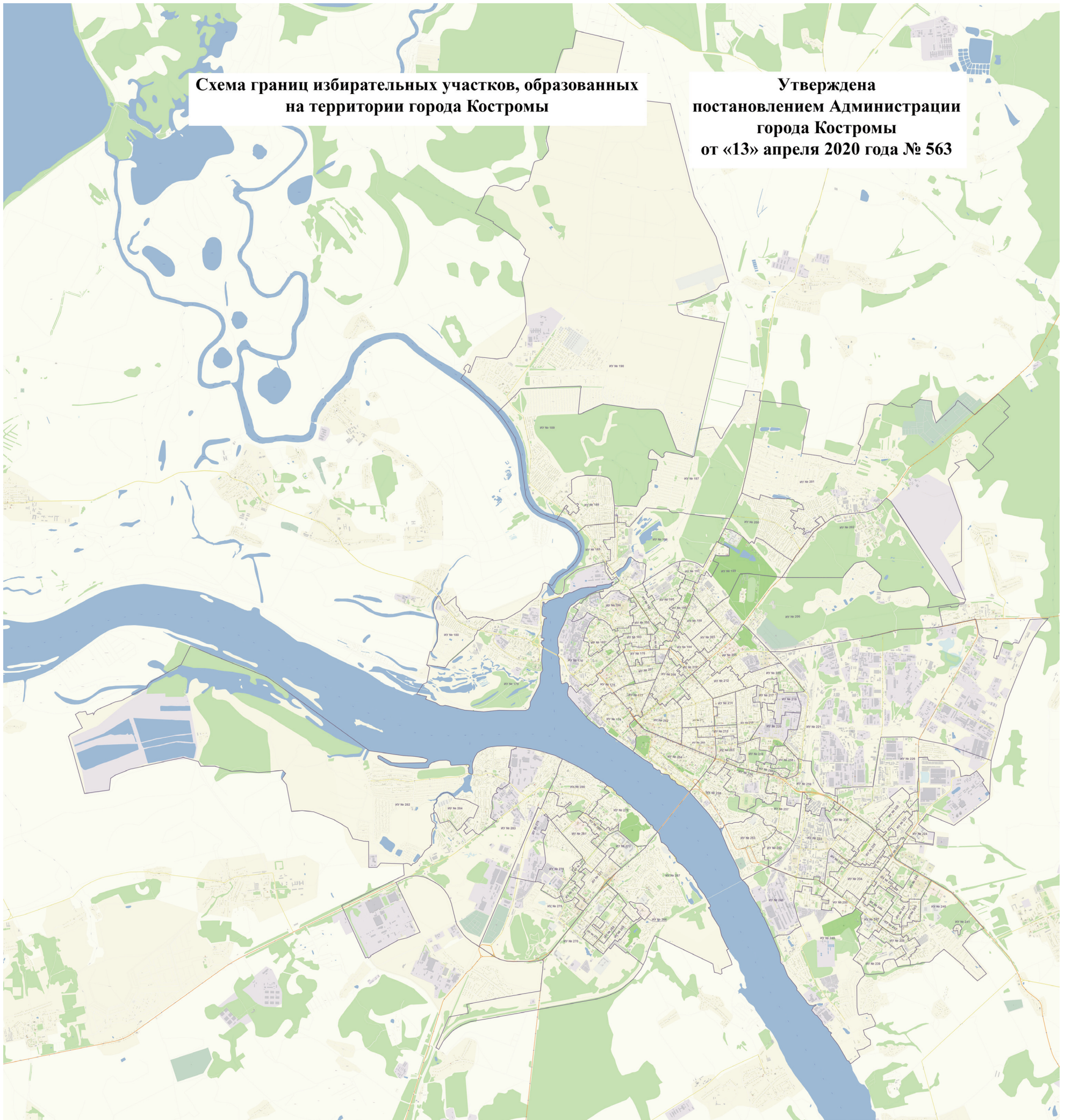
Схема границ избирательных участков, образованных на территории города Костромы

Затраты по вывозу и хранению будут возмещены за Ваш счет.